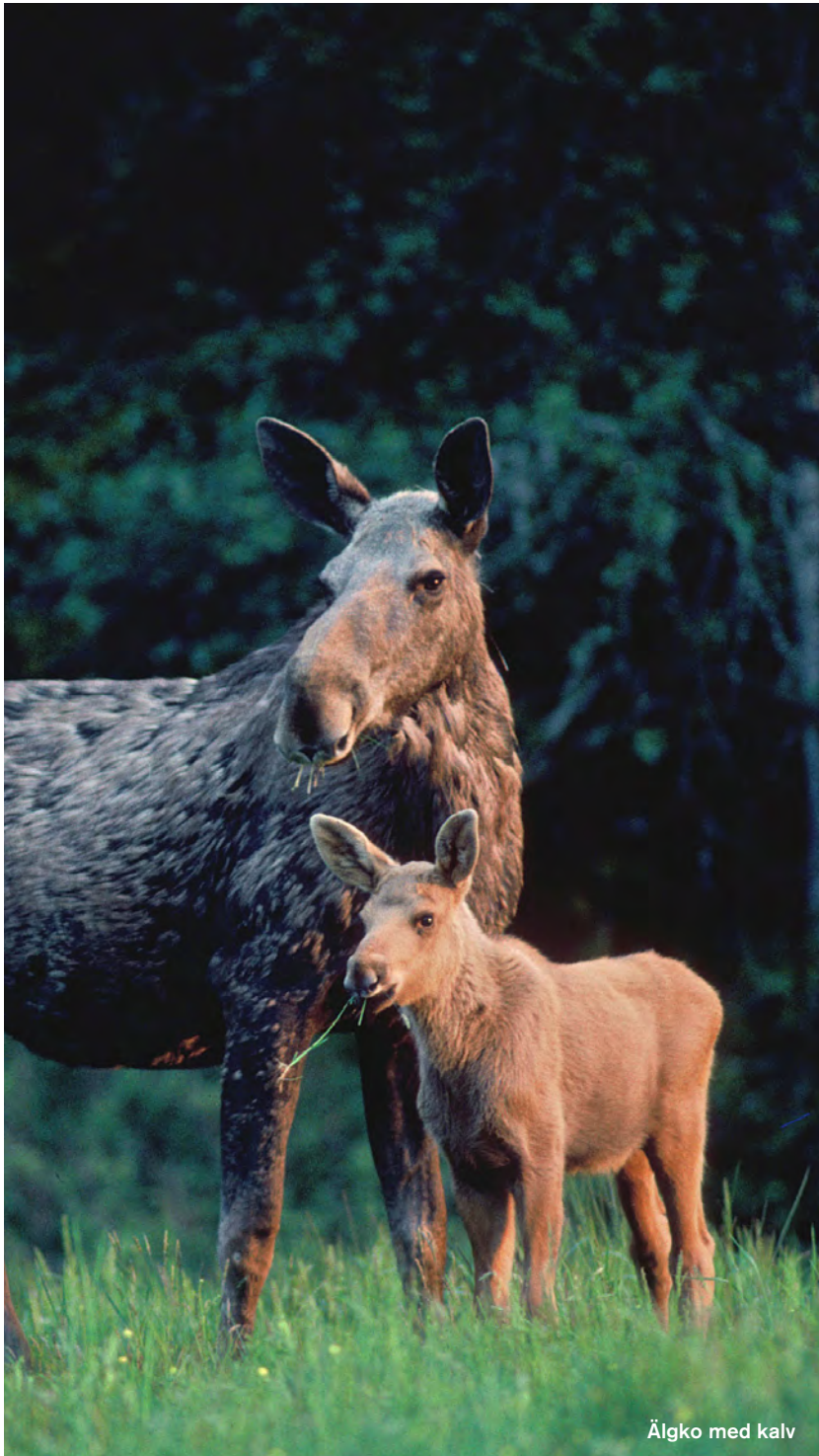
Älgko med kalv