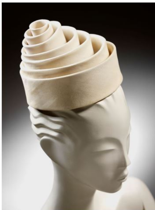
Spiralhatt, siden, Balenciaga för Elsa, Spanien, 1962

Du får skåda en lång rad originalplagg och får även veta mer om hur han arbetade i ateljén med att konstruera kläderna. Dessutom visas coutureplagg från andra designers som verkar i Balenciagas anda.