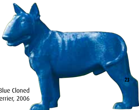
Blue Cloned English Terrier, 2006