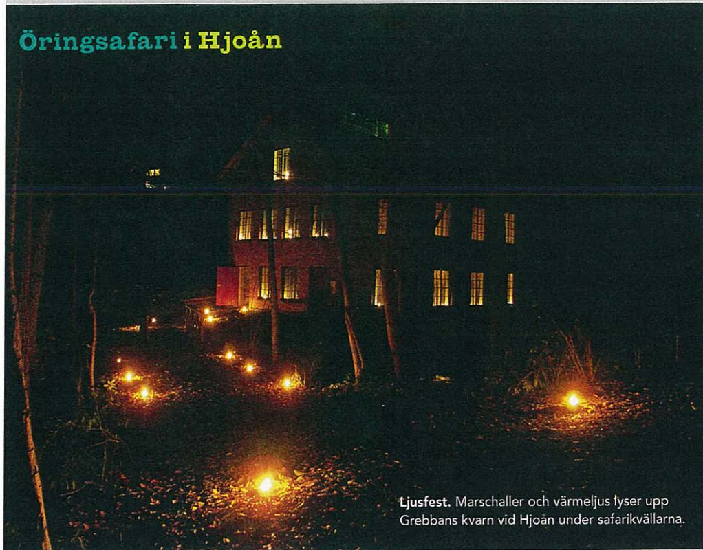
Ljusfest. Marschaller och värmeljus lyser upp Grebbans kvarn vid Hjoån under safarikvällarna.

F icklampans sken lyser upp en lekboten och där står de. Ett öringpar på 4–5 kg. Den intensiva leken upphör för ett ögonblick och något störda av ficklampan backar de för att söka skydd i den djupare huvudströmfåran. Vi släcker ficklampan och lämnar dem ifred.