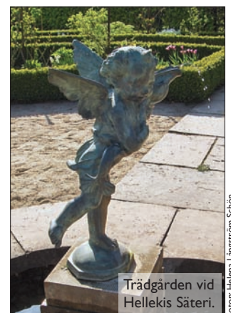
Trädgården vid Hellekis Säteri.

Bad. Både vid Kinnekulle camping och vid Söcke finns det goda möjligheter till ett dopp.