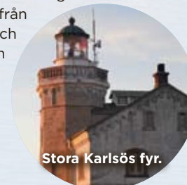
Stora Karlsös fyr.

Priser: Stora Karlsö från 450 kr per person och natt och Högbonden från 300 kr per person. Kostnad för måltider och transport tillkommer! Info: storakarlso.se hogbonden.se