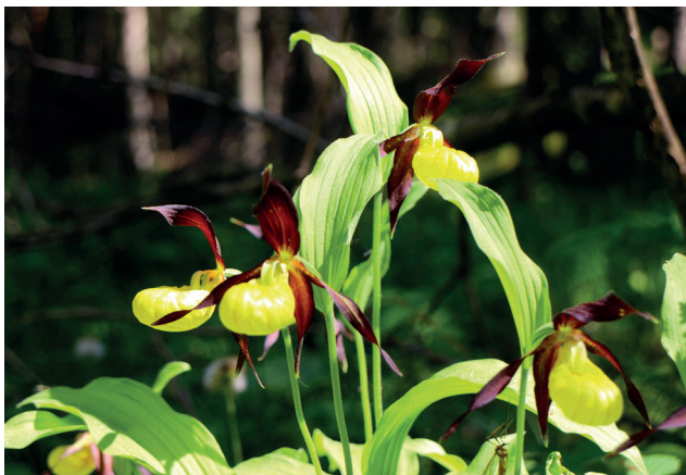
Blommande guckusko i Skärbo naturreservat.