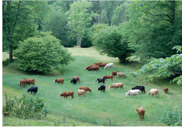
Kvigor på Gärdshögen.

Större delen av reservatet utgörs av barrskog med inslag av lövskog. Odlingsmarkerna kring Skärbogården består av en mosaik av nedlagd åkermark och lövträdsbevuxna ängs- och hagmarker. Här växer ädellövträd som ask, alm, lind och lönn. Hassel bildar höga buskage med tätt stående stammar, så kallade hässlen.