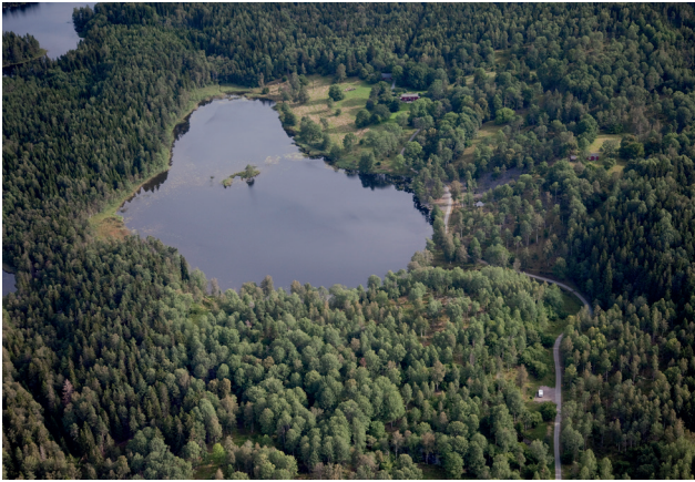
Stora Skärbotjärn med gården i bildens övre del.