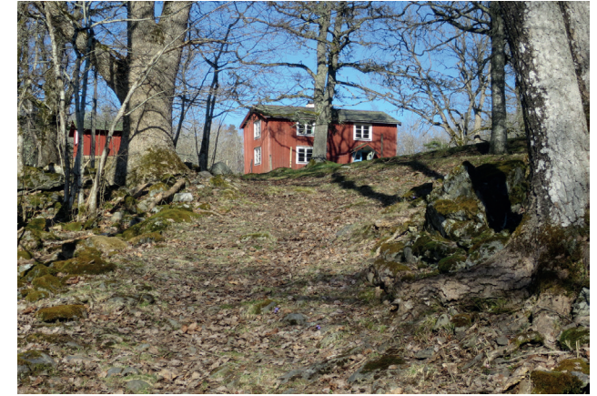
Torpet Åsen, brukat fram till 1969.

Landskapet visar på en lång kontinuitet av odling. Än idag har de små åkertegarna som följer terrängen, ängsmarkerna, alla odlingsrösen samt stigar och vägar samma former och ligger på samma platser som för 300 år sedan. Marken upphörde att brukas som åker och äng under 1960-talet och hävdas sedan dess huvudsakligen med bete.