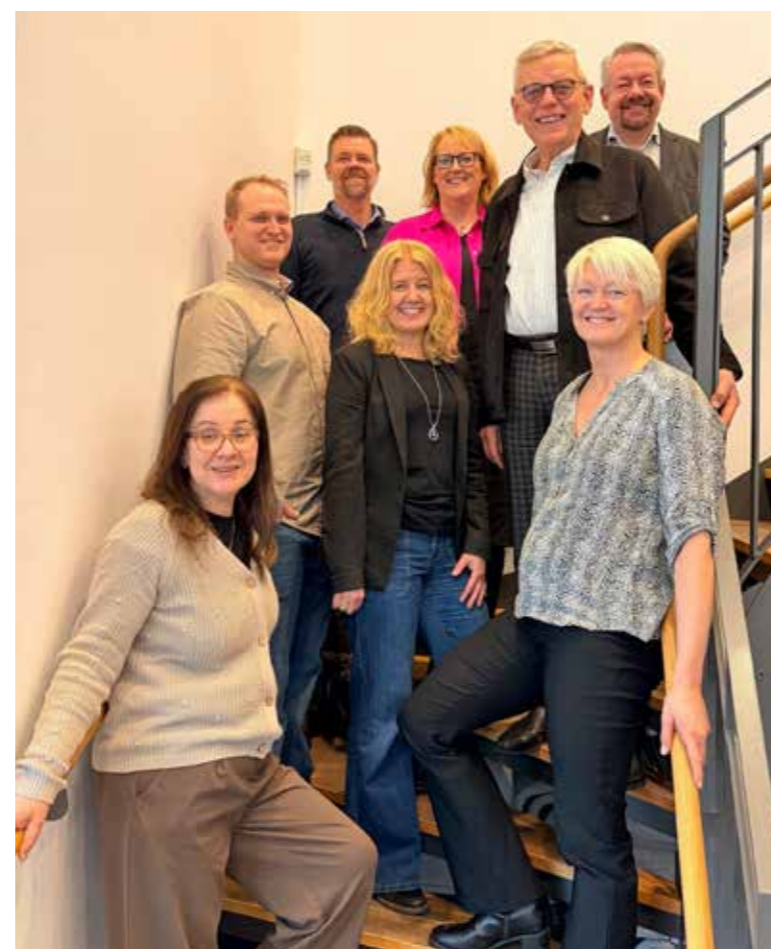
Next Skövdes styrelse

Det finns inga väsentliga händelser efter räkenskapsårets slut.