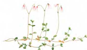
Linnea Linnea borealis