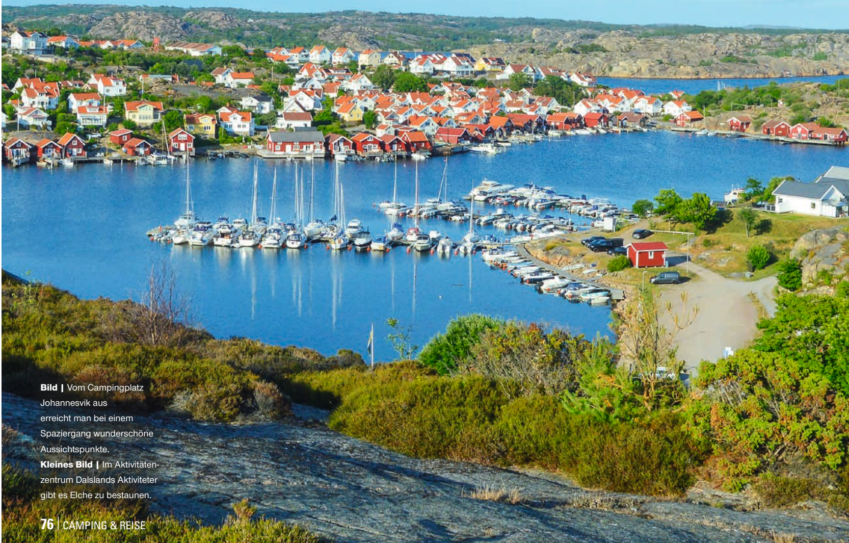
Bild | Vom Campingplatz Johannesvik aus erreicht man bei einem Spaziergang wunderschöne Aussichtspunkte.

Kleines Bild | Im Aktivitätszentrum Dalslands Aktiviteter gibt es Elche zu bestaunen.