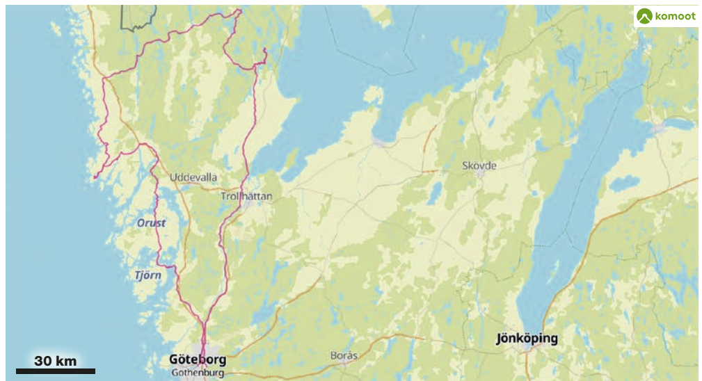
KARTE: Von Göteborg führt die Wohnmobiltour nach Norden und in einem großen Bogen wieder zurück.

Kunsthandwerk, ein Café und einen Süßigkeitenladen gibt. Im Kronhuset selbst finden außerdem Konzerte statt. Darüber hinaus gibt es wichtige Männer in Bronze zu sehen, Gustav Adolf zum Beispiel, einen schwedischen König.