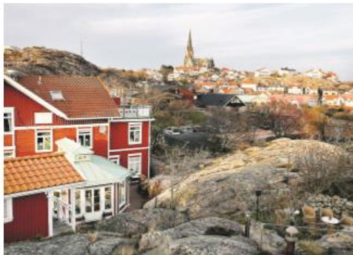
Riksdagshuset i Lerum. Bohuslän är ett av de mest kargaste länen i Sverige.