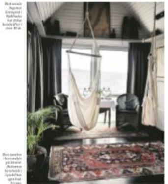
En skaldjurskocken Mats Larsson i Lerum.