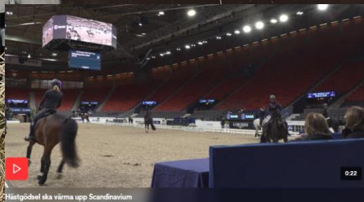
Hästgödsel ska värma upp Scandinavium

Totalt 240 hästar fanns i Scandinavium under Gothenburg Horse Show. Deras gödsel har nu samlats ihop och ska omvandlas till energi som räcker för att värma upp Scandinavium i tre dygn. Det är en del i evenemangets och Got Events satsning på hållbarhetsfrågor. Lyssna på P4 Göteborgs inslag nedan: