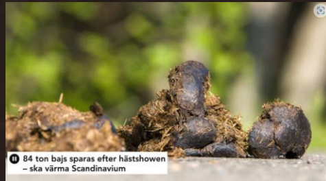
84 ton bajs sparas efter hästshowen – ska värma Scandinavium