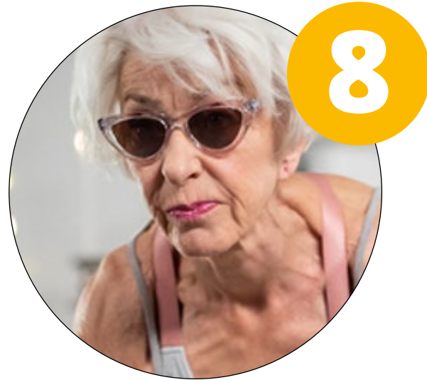
Silver-influencer /The YOLO years