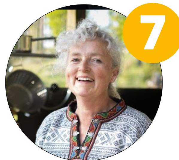
Lokala platser & personliga möten