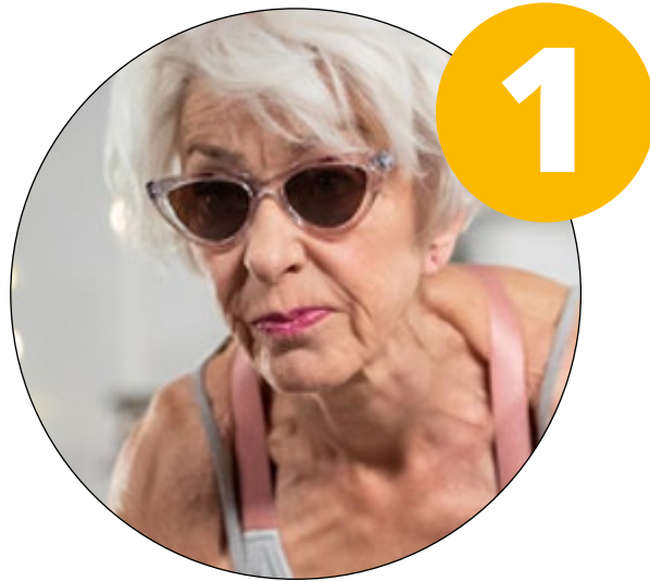
Silver-influencer /The YOLO years