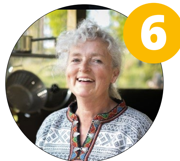
Lokala platser & personliga möten