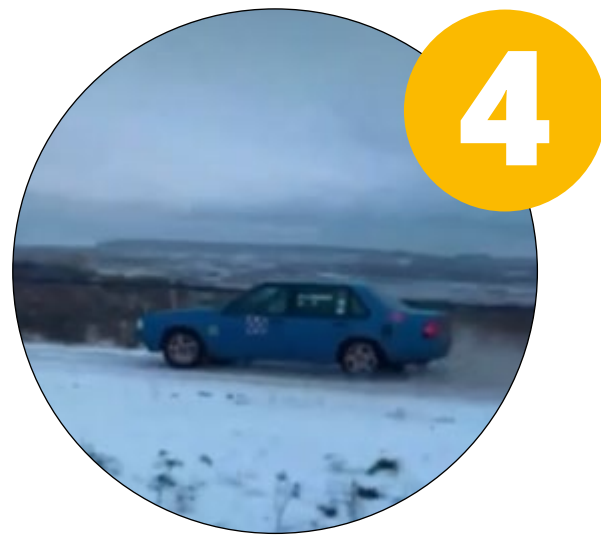
Innehåll som känns äkta