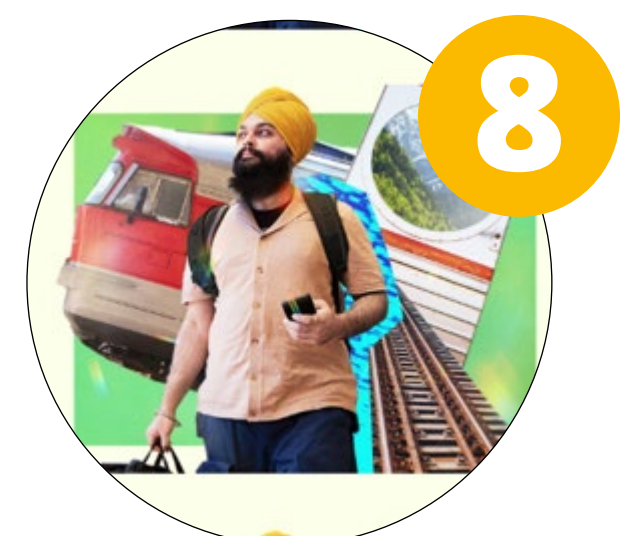
All aboard (kollektivtrafik)