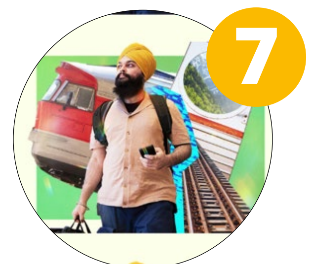
All aboard (kollektivtrafik)