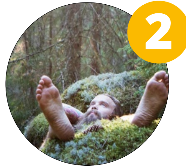
Sinnesro & friskvård