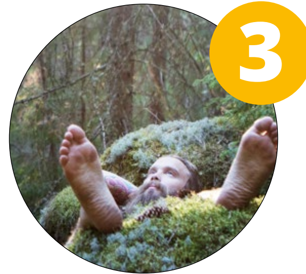
Sinnesro & friskvård