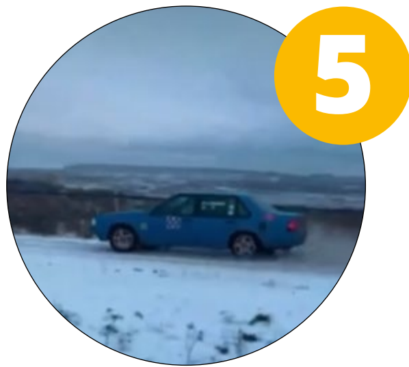
Innehåll som känns äkta